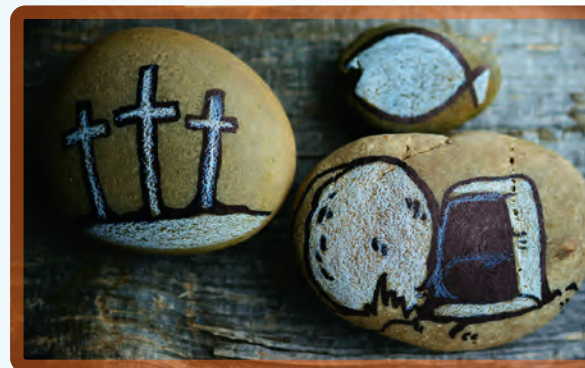
Ab 5. Oktober startet ein Kurs über fünf Abende: „Glauben heißt... ja was denn eigentlich?“