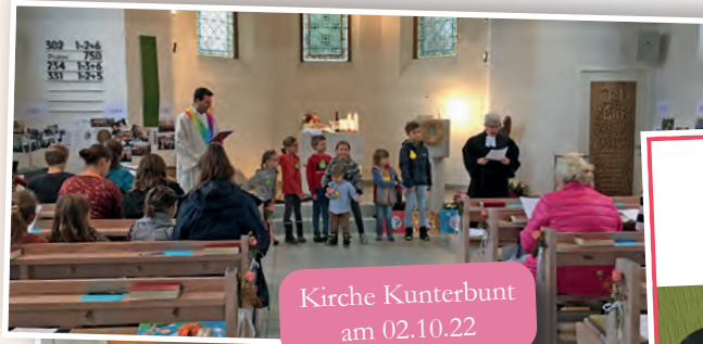
Kirche Kunterbunt am 02.10.22